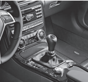
Zierelemente AMG Carbon