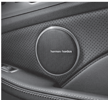
Harman Kardon® Logic7® Surround-Soundsystem