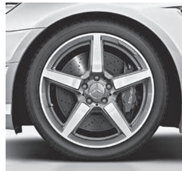
45,7 cm (18") AMG Leichtmetallrad im 5-Speichen-Design (790)