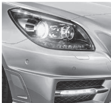
Intelligent Light System (Darstellung mit Sport-Paket AMG)