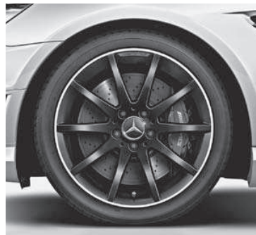
45,7 cm (18") AMG Leichtmetallrad im Vielspeichen-Design, Mattschwarz lackiert (760)