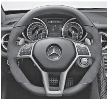
AMG Performance Lenkrad in Leder Nappa/Alcantara®