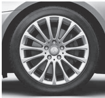
43,2 cm (17") Leichtmetallrad im Vielspeichen-Design (R81)