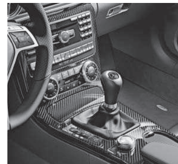
Zierelemente AMG Carbon