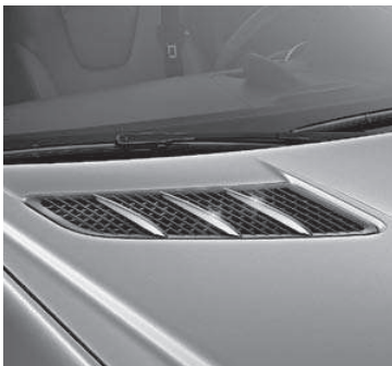
Finnenaufsätze für die Motorhaube