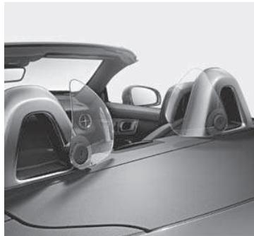
AIRGUIDE und Überrollbügel mit Einleger Aluminium eloxiert