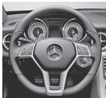
Multifunktionslenkrad im 3-Sp.-Design, unten abgeflacht