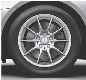
40,6 cm (16") Leichtmetallrad im 10-Speichen-Design (39R) (Serie SLK 200)