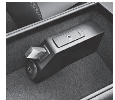
USB-Schnittstelle und AUX-IN- Anschluss in der Mittelkonsole