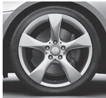
45,7 cm (18") Leichtmetallrad im 5-Speichen-Design (R32)