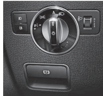
Feststellbremse elektrisch mit Komfortfunktion