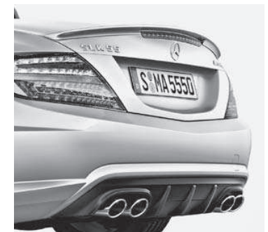
AMG Heckschürze, Abrisskante und Sport-Abgasanlage