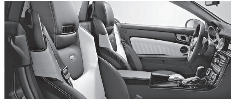
designo Leder Exklusiv zweifarbig