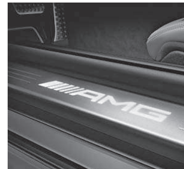
AMG Einstiegsschienen beleuchtet