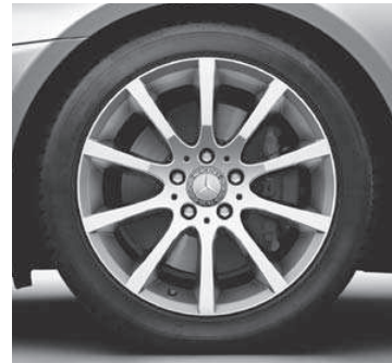
43,2 cm (17") Leichtmetallrad im 10-Speichen-Design (R35) (Serie SLK 350)