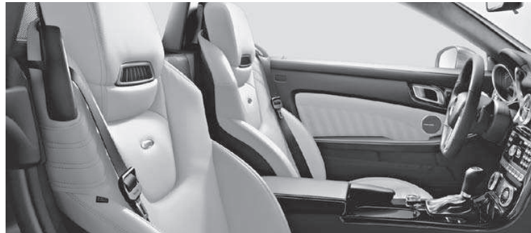
designo Leder Exklusiv einfarbig