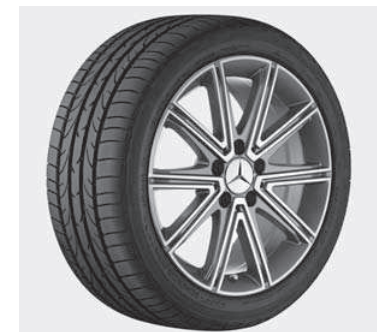
10-Speichen-Design, Palladiumsilber, glanzgedreht