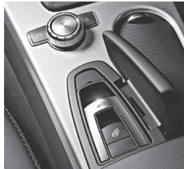
Dach-Bedieneinheit und zentrales Bedienelement