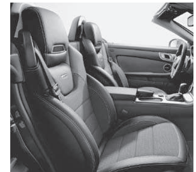
AMG Sportsitze mit Ledernachbildung ARTICO/Stoff