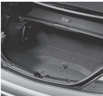
Kofferraum mit Wendeboden