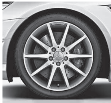
45,7 cm (18") AMG Leichtmetallrad im Vielspeichen-Design, Titangrau lackiert (796)