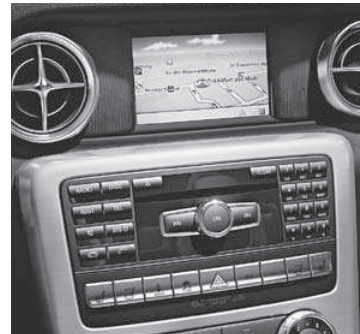
Becker® MAP PILOT für Audio 20 CD