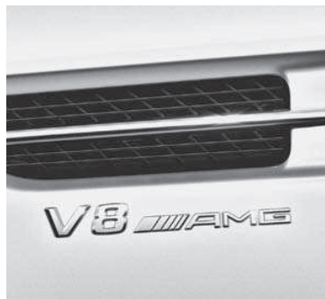
»V8 AMG« Schriftzug