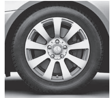
40,6 cm (16") Leichtmetallrad im 9-Speichen-Design (R12)