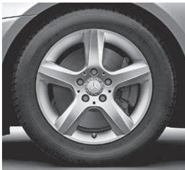
40,6 cm (16") Leichtmetallrad im 5-Speichen-Design (R19)