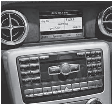
Audio 20 CD