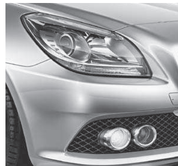
Klarglas-Scheinwerfer, Tagfahrlicht und Nebelscheinwerfer