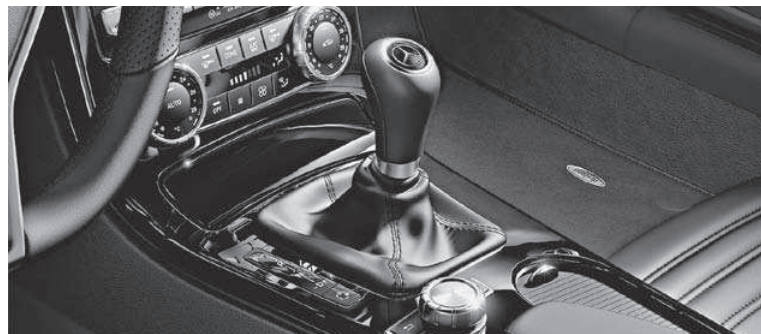
designo Zierelemente in Klavierlack schwarz