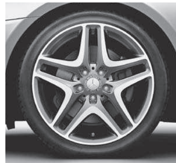
45,7 cm (18") Leichtmetallrad im 5-Doppelspeichen-Design (22R)