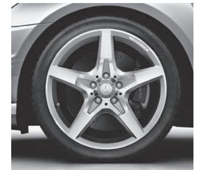
45,7 cm (18") AMG Leichtmetallrad im 5-Speichen-Design, glanzgedreht