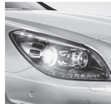
Scheinwerfer mit dunkler Einfassung