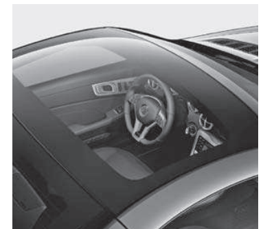
Panorama-Variodach mit MAGIC SKY CONTROL