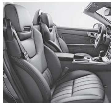
Sitze im spezifischen Längspfeifen-Design