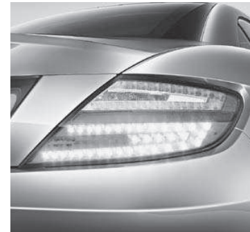
Heckleuchten in LED-Technik