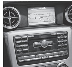
Becker® MAP PILOT für Audio 20 CD