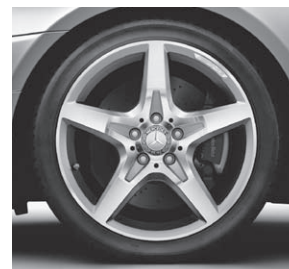
45,7 cm (18") AMG Leichtmetallrad im 5-Speichen-Design (782)