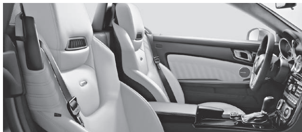
designo Leder Exklusiv einfarbig