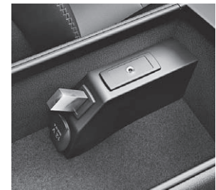
USB-Schnittstelle und AUX-IN- Anschluss in der Mittelkonsole