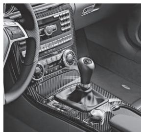
Zierelemente AMG Carbon