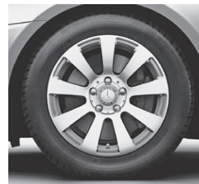
40,6 cm (16") Leichtmetallrad im 9-Speichen-Design (R12)