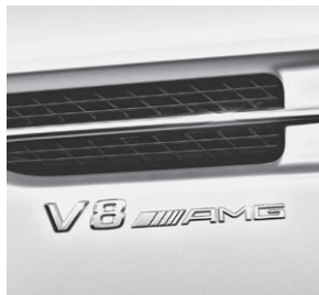
»V8 AMG« Schriftzug