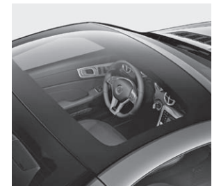
Panorama-Variodach mit MAGIC SKY CONTROL