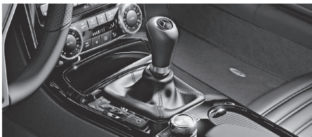
designo Zierelemente in Klavierlack schwarz