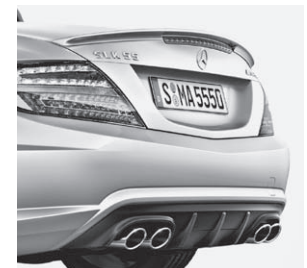
AMG Heckschürze, Abrisskante und Sport-Abgasanlage