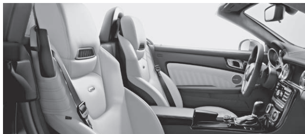
designo Leder Exklusiv einfarbig