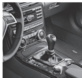
Zierelemente AMG Carbon