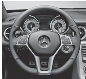
Multifunktionslenkrad im 3-Sp.-Design, unten abgeflacht