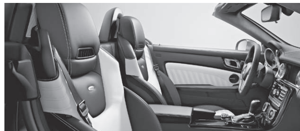
designo Leder Exklusiv zweifarbig