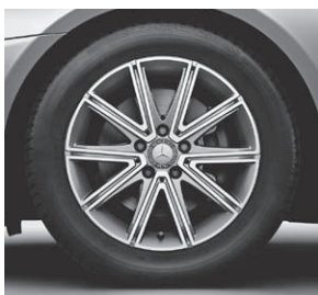
43,2 cm (17") Leichtmetallrad im 10-Speichen-Design (R93)