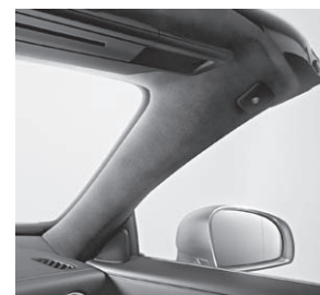
designo Scheibenrahmen Mikrofaser DINAMICA