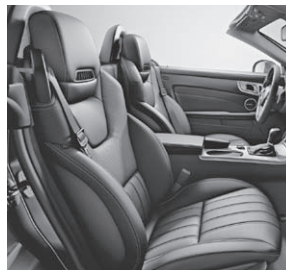
Sitze im spezifischen Längspfeifen-Design