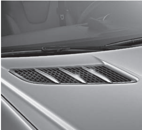
Finnenaufsätze für die Motorhaube